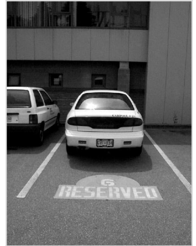
À l'Université de la Colombie-Britannique à Vancouver, C.-B., les covoitures inscrites ont droit à des places réservées.

La signalisation. L'utilisation de signes qui identifient clairement les places de stationnement privilégié facilite la surveillance et l'application des règles. Les employés doivent reconnaître les signaux et comprendre ce qu'ils signifient. La signalisation des zones de stationnement privilégié peut être produite sur mesure ou achetée chez un fournisseur d'enseignes. Des marques spéciales sur le sol peuvent aider à renforcer la nature des places réservées, mais n'ont pas de pouvoir juridique et ne peuvent être utilisées qu'en plus d'une bonne signalisation.